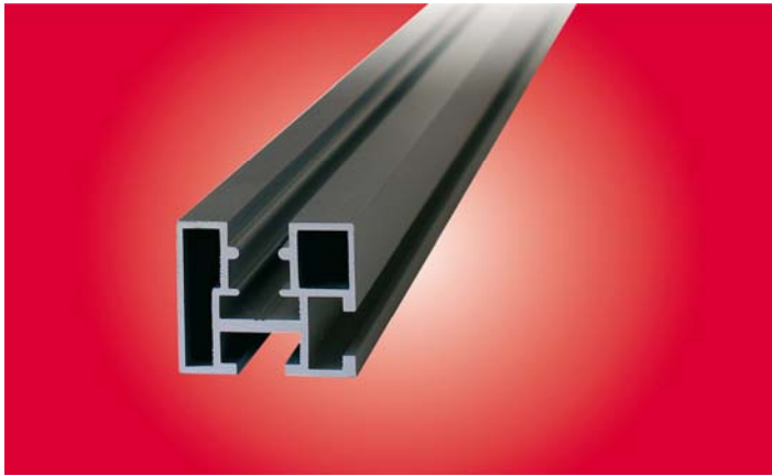
Montageprofil Benz ohne Kanal